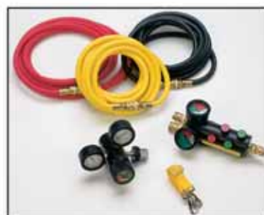
22-890300 Master Kit de Contrôle