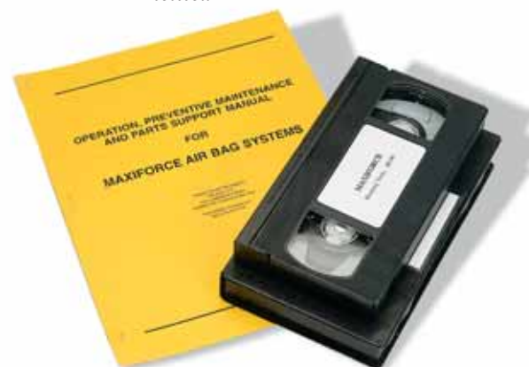
Les manuels sont conformes aux cahiers des charges de l'armée U.S.