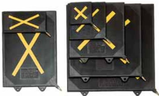
22-889092 Jeu de 7 coussins de levage - "Véhicule ou camion de sauvetage" - 83 Tonnes