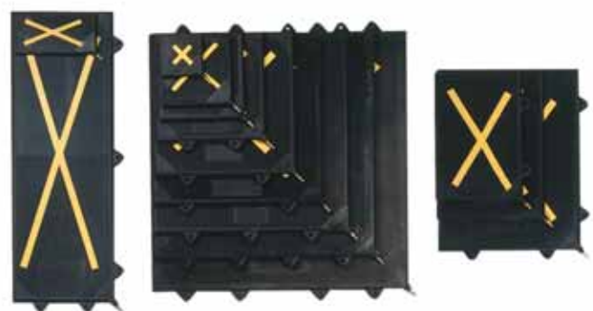
22-889346 Jeu de 14 coussins de levage - "Sauvetage Lourd"- 314 Tonnes