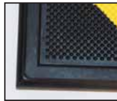
Surface d'alvéoles saillantes

* Les normes établies par un pays spécifique en tant que restriction commerciale ne font pas partie de l'allégation ci-dessus.