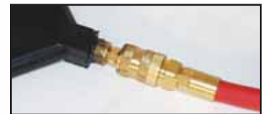
Raccord de verrouillage de sûreté en deux temps