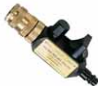
22-890490 Soupape de décharge Qté. 20