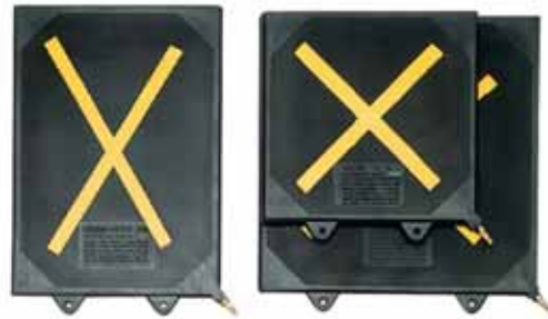
22-889050 Jeu de 3 coussins de levage - "Sauvetage Rural"- 45 tonnes