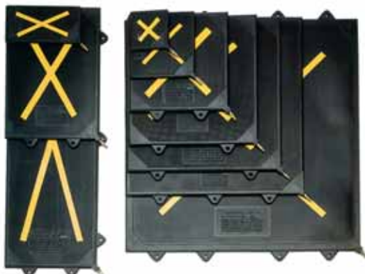
22-889245 Jeu de 10 coussins de levage - "Gotham City"- 222 Tonnes