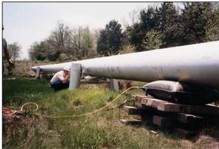
Soulever et niveler des pipelines inaccessibles aux équipements lourds.

“Le Service Incendie s’est rendu sur les lieux d’un accident d’avion pour des blessures légères et une importante fuite de carburant. Des coussins d’air Maxiforce ont été utilisés pour redresser l’avion afin d’éviter que le carburant restant ne continue de fuir. Le carburant restant a été vidé.”