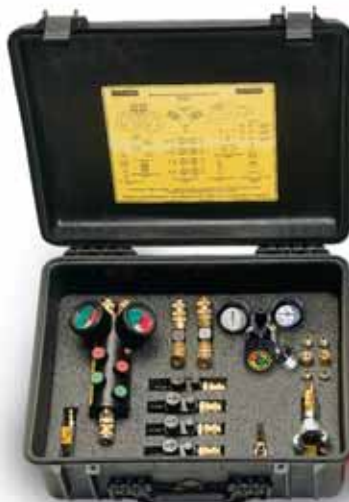
890300 « Master » kit de contrôle Qté. 2