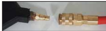
Raccord auto-bloquant remplaçable sur le terrain