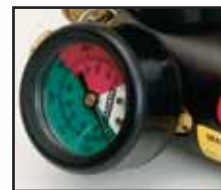
Manomètre de pression très lisible