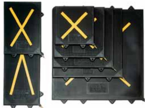
22-889234 Jeu de 7 coussins de levage - "Tous Terrains"- 212 Tonnes