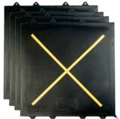
22-888200 KPI-74 Qté. 4