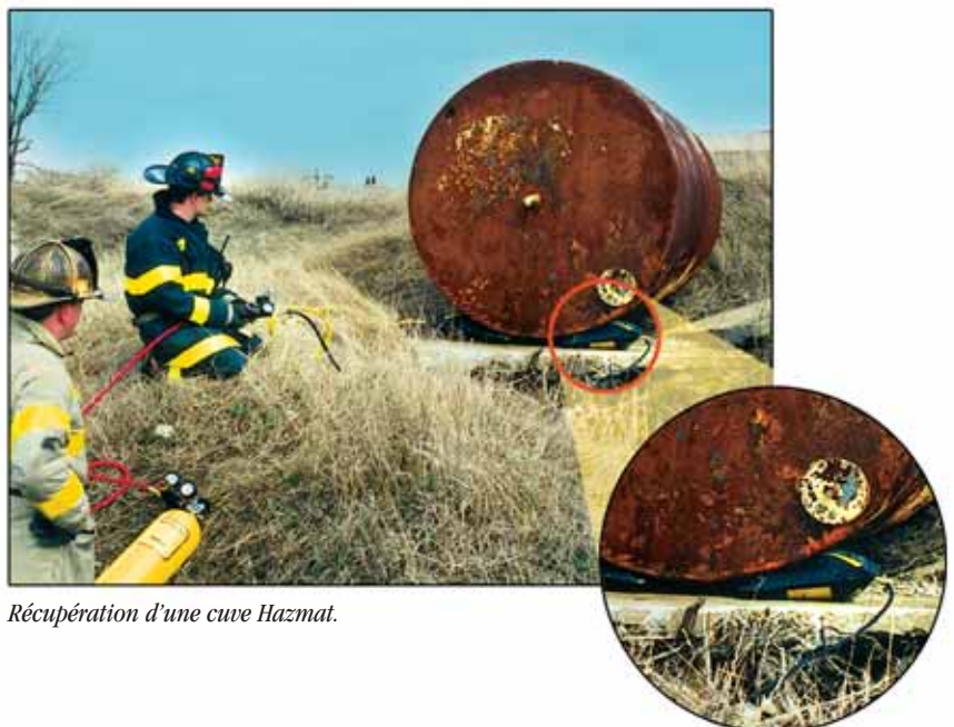
Récupération d’une cuve Hazmat.

“Le sauvetage d’un conducteur de bulldozer coincé sous sa machine a nécessité l’utilisation de deux coussins 90 x 90cm (KPI-74). Placés de chaque côté du bulldozer, les coussins ont été gonflés en même temps, créant un espace suffisant pour dégager l’opérateur du bulldozer.”