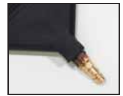
Raccord d'entrée en bronze