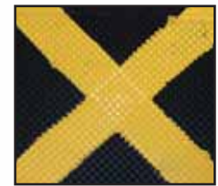
Marquage du centre de levage très visible