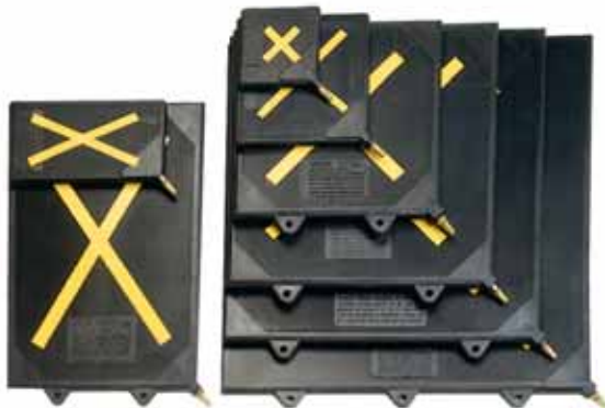
22-889136 Jeu de 8 coussins de levage- "Equipe accident"- 123 Tonnes