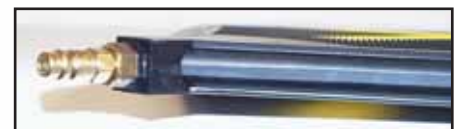
Le coussin de levage le "plus fin" est le meilleur