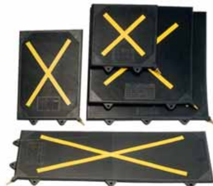
22-889117 Jeu de 5 coussins de levage - "Sauvetage Urbain" - 106 Tonnes