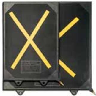
22-889048 Jeu de 2 coussins de levage- 43 tonnes