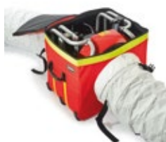
V-Box im Entlüftungsmodus