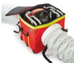
V-Box im Belüftungsmodus