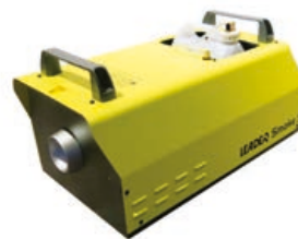
LEADER Smoke 3