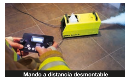
Mando a distancia desmontable