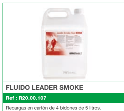
FLUIDO LEADER SMOKE

PARA UN HUMO DENSO, REALISTA Y SIN PELIGRO