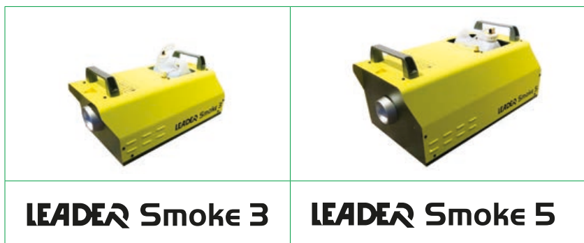
LEADER Smoke 3