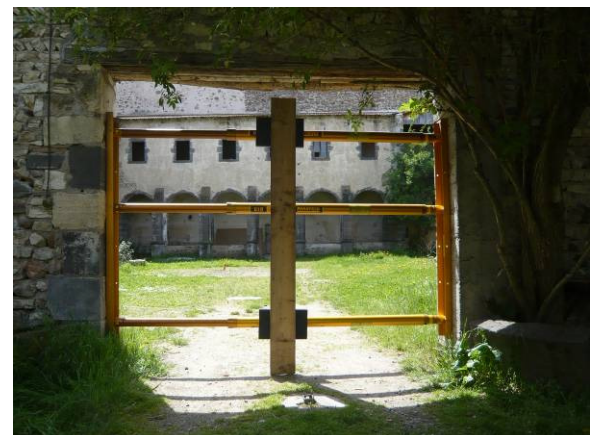
Etais volants type 1