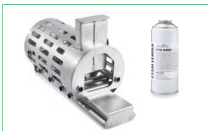
Explosión de aerosol

Alto: 35,5 cm / Ancho: 32,5 cm / Pr.: 56 cm / Peso: 6,8 kg