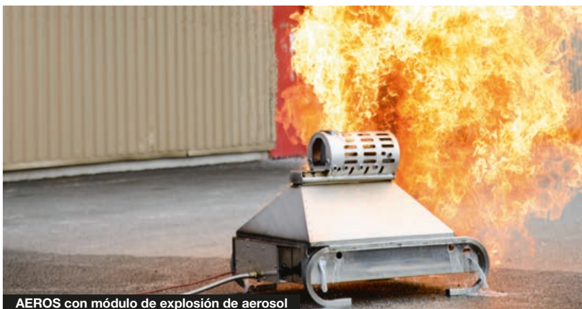
AEROS con módulo de explosión de aerosol

1 puerta con llave amovible que se fija sobre el módulo de Pantalla plana (Ref.: V90.80.071). Alto: 38,0 cm / Ancho.: 46,5 cm / Pr.: 11,0 cm (base: 14,5 cm) Peso: 6,5 kg