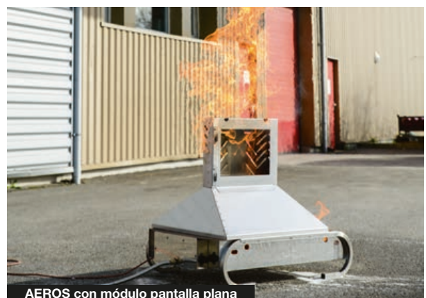
AEROS con módulo pantalla plana

En el marco de nuestra política de constante investigación para mejorar nuestros productos, nos reservamos el derecho de modificar sus características técnicas en todo momento sin información previa. Imágenes no contractuales