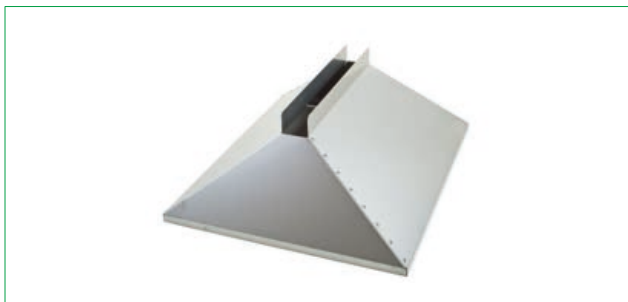
Adaptador para GF42 y AEROS 2

Necesarios para la instalación de los módulos de formación - Garantía: 1 año