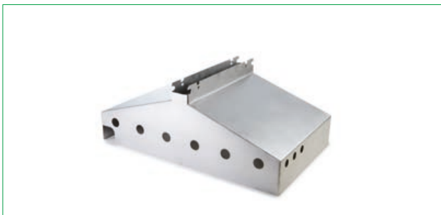
Adaptador para PYROS 3

Alto: 27,5 cm / Ancho: 71,0 cm / Pr.: 61,5 cm / Peso: 8 kg