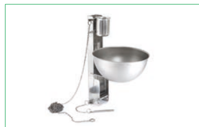
Explosión de aceite

Utilizar únicamente con los aerosoles LEADER. Alto: 22,5 cm / Ancho: 26 cm / Pr.: 20 cm / Peso: 6,9 kg