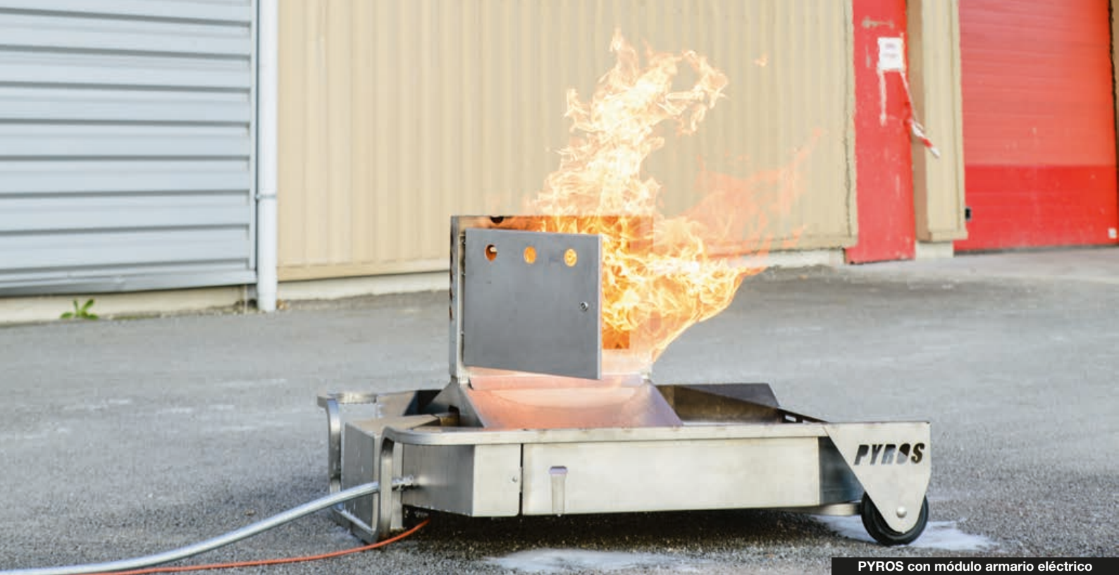
PYROS con módulo armario eléctrico