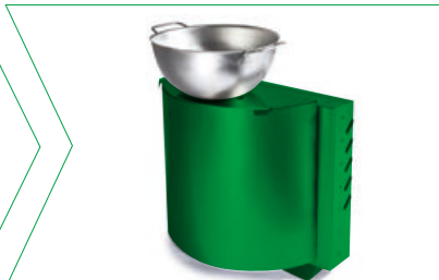
Feu de friteuse

Se fixe sur le module Ecran plat (Réf. V90.80.071). H: 35,5 cm / L: 39,5 cm / P: 18,0 cm / Poids: 2,9 kg