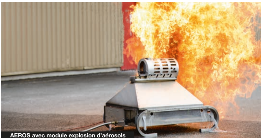
AEROS avec module explosion d'aérosols

1 Porte avec clef amovible se fixant sur le module Ecran plat (Réf. V90.80.071). H : 38,0 cm / L : 46,5 cm / P : 11,0 cm (base: 14,5 cm) Poids : 6,5 kg