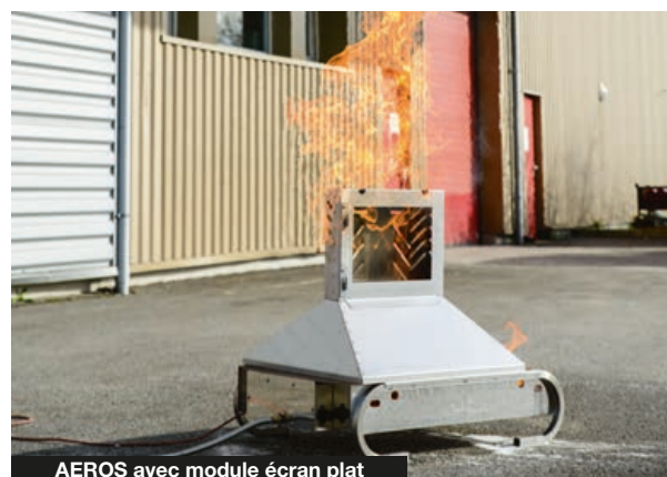
AEROS avec module écran plat

Dans le cadre de notre politique de recherche constante pour une amélioration de nos produits, nous nous réservons le droit de modifier leurs caractéristiques techniques à tout moment sans information préalable. Visuels non contractuels