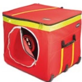
Cubo V-Box sin manguera